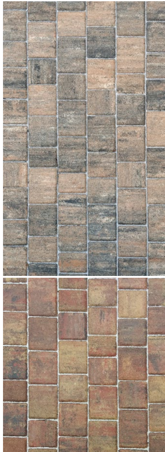
↑↑ RUSTIKAL PFLASTER muschelkalk

Achten Sie bei der Verlegung darauf, aus mehreren Paketen zu mischen , so dass keine Kreuzfuge entsteht. So erhält man den typisch lebhaften Eindruck.