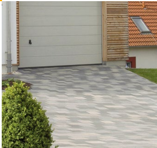
VIA VOLPE PFLASTER MIT MINIFASE grau-color