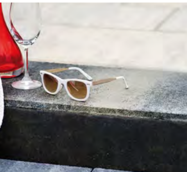
BLOCKSTUFE – Farbe in Sonderproduktion